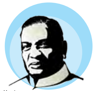
डॉ. शंकरराव चव्हाण जन्मशताब्दी वर्ष

ज्येष्ठ नेते शंकरराव चव्हाण यांच्याबरोबर मला जवळून काम करण्याचा योग आला. प्रथम ते महाराष्ट्राचे मुख्यमंत्री असताना, मुख्यमंत्र्यांचा सचिव तसेच प्रधान वित्तसचिव म्हणून आणि त्यानंतर ते केंद्र शासनात गृहमंत्री असताना केंद्रीय गृहसचिव म्हणून. शंकरराव चव्हाण यांची प्रतिमा एक कणखर, सचोटीचा व करारी प्रशासक अशी होती आणि ती आजवरही कायम आहे, असे म्हणावे लागेल. सरदार पटेल यांना राज्यघटना तयार करताना जे राजकीय नेतृत्व अभिप्रेत होते तेच शंकररावांच्या रूपाने आपण पाहिले.