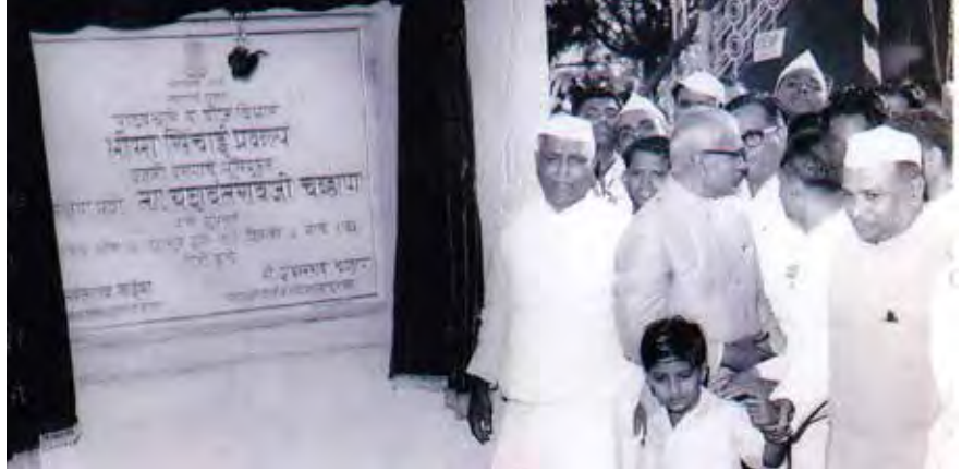
भीमासिंचाई प्रकल्प उजनी धरणाचे भूमिपूजन प्रसंगी यशवंतराव चव्हाण, वसंतराव नाईक, शंकरराव चव्हाण आणि त्यांचा हातात हात धरलेले अशोक चव्हाण.