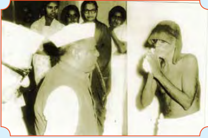
वर्धा येथील पवनार आश्रमात विनोबा भावे यांची भेट घेताना शंकरराव चव्हाण.