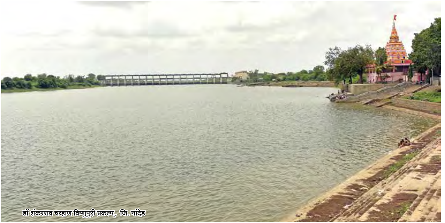
डॉ शंकरराव चव्हाण विष्णुपुरी प्रकल्प, जि. नांदेड