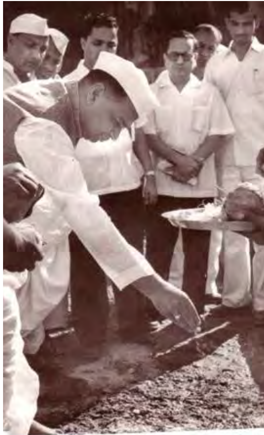
पुराण प्रकल्पातील कामांचा शुभारंभ.

या धोरणामुळे प्रकल्पाचे कालवे दरवर्षी आठ महिनेच (जुलै ते फेब्रुवारी) चालणार आहेत. उन्हाळ्यातील चार महिन्यात शेतकऱ्यांना फळबाग, ऊसासारखे बारमाही पीक भूजलावर विहिरीद्वारे घेण्याची मुभा आहे. हा निर्णय नवीन सिंचन प्रकल्पांचाच लागू केला आणि जुन्या प्रकल्पात काही बदल केला नाही. पाण्याची चणचण असणाऱ्या दुष्काळी प्रदेशाला हा निर्णय लागू केला