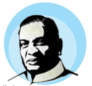
डॉ. शंकरराव चव्हाण जन्मशताब्दी वर्ष

स्वातंत्र्यपूर्वकाळात सर्वसामान्य कुटुंबात जन्मलेल्या शंकरराव चव्हाण यांचा उच्च शिक्षणापर्यंतचा प्रवास खडतर आणि परिश्रमाचा होता. अन्यायी राजवटीविरोधात आवाज उठवायचा असेल तर शिक्षणासारखे हत्यार आपल्या हातात असले पाहिजे, या ध्येयाने त्यांनी शिक्षण घेतले. पडेल ते कष्ट केले. शिकवण्या घेऊन शुल्क भरले पण हार मानली नाही. त्यांच्या पुढील प्रवासाचा पाया त्यांच्या या कष्टाने निर्माण केला. त्यामुळेच शिक्षण घेणाऱ्या गरीब मुलांप्रति ते नेहमीच कनवाळू राहिले.