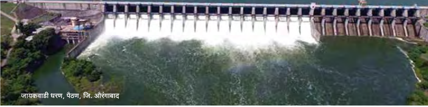
जायकवाडी धरण, पैठण, जि. औरंगाबाद

माजी मुख्यमंत्री शंकरराव चव्हाण यांनी सिंचनासाठी अनेक महत्त्वपूर्ण प्रकल्प उभारून राज्यात मोठी सिंचनक्षमता निर्माण केली. राज्याच्या मंत्रिमंडळात संधी मिळाल्यानंतर त्यांनी पाटबंधारे विभागाची प्रामुख्याने निवड केली. १९७५ मध्ये मुख्यमंत्री झाल्यानंतर त्यांनी पाटबंधारे खाते आपल्याकडेच ठेवले. १९६० ते १९८० या कालावधीत ते सुमारे १४ वर्ष पाटबंधारे विभागाचे मंत्री होते. त्यांनी आपल्या कार्यकाळात भीमा, गोदावरी, चंद्रभागा या नद्यांवर मोठमोठ्या धरणांची निर्मिती केली. कोयना, जायकवाडी, विष्णुपुरी, कळम्मावडी, भीमा प्रकल्प, अप्पर वर्धा प्रकल्प, येलदरी धरण, अरुणावती, लेंडी धरण, बाभळी, सिद्धेश्वर आदी धरणे बांधून त्यांनी राज्यात हरितक्रांती घडवून आणली. त्याचबरोबर पारस, कोराडी, चंद्रपूर, परळी आदी ठिकाणी वीज निर्मिती केंद्रे सुरू करण्यावर त्यांचा भर राहिला. पाणी व वीज मुबलक उपलब्ध झाल्याने त्याचा लाखो शेतकऱ्यांना फायदा झाला. हे प्रकल्प म्हणजे श्री. चव्हाण यांची स्मृतिस्मारकेच. यांच्या कार्यकाळात उभे राहिलेले काही प्रातिनिधिक प्रकल्प.