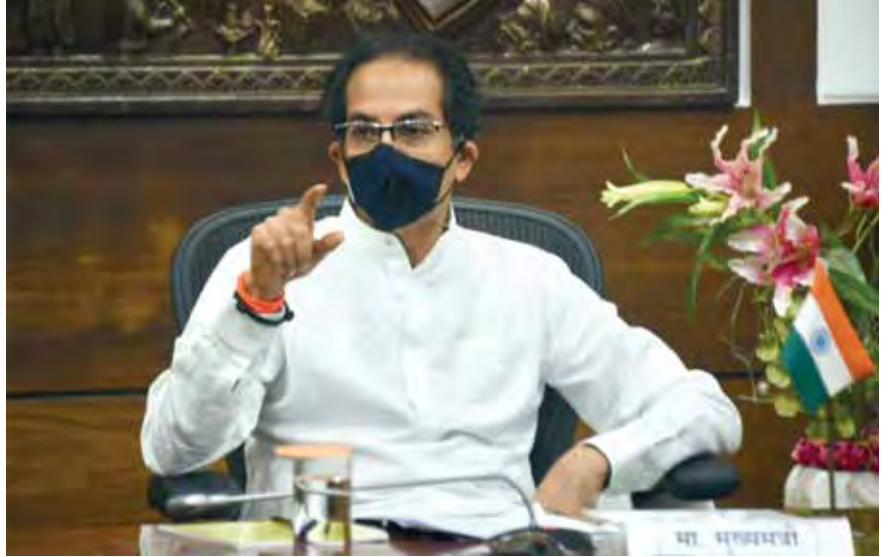
जनतेशी संवाद साधताना मुख्यमंत्री उद्धव बाळासाहेब ठाकरे.

कोरोनाच्या रुग्णांवर उपचार करण्यासाठी प्लाझ्मा थेरपीचा वापर राज्यात होत असून त्यामुळे रुग्णांना त्याचा फायदा होत आहे. या थेरपीचा वापर व्यापक प्रमाणात होण्यासाठी महाराष्ट्रात जगातली सर्वात मोठी प्लाझ्मा थेरपी ट्रायल केली जात आहे. त्या सुविधेचे उद्घाटन नुकतेच मुख्यमंत्री उद्धव ठाकरे यांच्याहस्ते झाले. राज्यातील २३ वैद्यकीय महाविद्यालयात