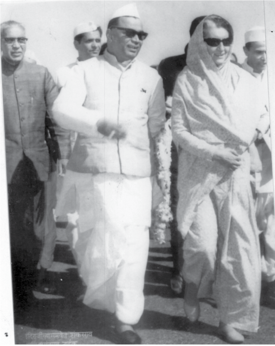
नांदेड विमानतळावर माजी प्रधानमंत्री इंदिरा गांधी यांच्यासमवेत शंकररावजी चव्हाण.

काँग्रेसचे ज्येष्ठ नेते शंकरराव चव्हाण यांच्या राजकीय जीवनाची सुरुवात नांदेड नगरपालिकेच्या नगराध्यक्ष पदापासून सुरू झाली. त्यानंतर महाराष्ट्राचे पहिले मुख्यमंत्री यशवंतराव चव्हाण यांच्या मंत्रिमंडळात उपमंत्रिपदावर काम करण्याची संधी मिळाली. तेथपासून पुढे त्यांची राजकीय जीवनाची कमान वाढतच राहिली. यानंतर त्यांनी मागे वळून कधीही बघितले नाही. मुख्यमंत्री, केंद्रीय गृहमंत्री, संरक्षणमंत्री, अर्थमंत्री या पदापर्यंत काम केलेल्या डॉ. शंकरराव चव्हाण हे राज्यसभा, लोकसभा, विधान परिषद आणि विधानसभा अशा केंद्र आणि राज्यातील चारही प्रतिनिधिगृहांचे सन्माननीय सभासद राहिले होते. राज्याच्या जडणघडणीत त्यांचा सिंहाचा वाटा राहिला. थोर स्वातंत्र्यसेनानी स्वामी रामानंद तीर्थ यांच्या नेतृत्वाखाली तयार झालेल्या शंकरराव चव्हाण यांनी शून्यातून विश्व