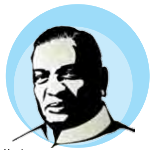
डॉ. शंकरराव चव्हाण

१९८० पासून ते केंद्रातील राजकारणात रमले. राज्याचे मंत्री, दोन वेळेस मुख्यमंत्री तर केंद्रात शिक्षण, नियोजन, अर्थ, गृह, परराष्ट्र आदी विभागांमध्ये काम करताना