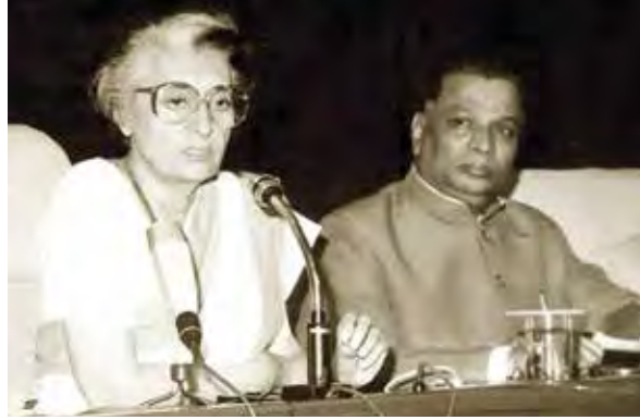
तत्कालीन प्रधानमंत्री इंदिरा गांधींसोबत शंकरराव चव्हाण.

इंदिरा गांधी यांनी विकासाचा वीस कलमी कार्यक्रम दिला होता. शंकरराव चव्हाणांनी त्याची काटेकोर अंमलबजावणी सुरू केली होती. त्यांच्या करारीपणामुळे अनेक योजना योग्य लाभार्थ्यांपर्यंत पोहोचल्या. या योजनांनी गरीब, दरिद्री नारायणाचे भले झाले पाहिजे असा त्यांचा