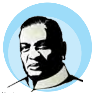
डॉ. शंकरराव चव्हाण

सिंचनातून सामाजिक न्याय प्रस्थापित करू इच्छिणाऱ्या आणि त्यासाठी मुख्यमंत्रीपद पणाला लावणाऱ्या शंकरराव चव्हाण यांची पाण्याच्या वापराविषयीची धोरणे आजच्या पिढीला समजणे आवश्यक आहे. दूरदृष्टीने निर्णय घेणे आणि आपण घेतलेल्या निर्णयावर ठाम असणे ही शंकरराव चव्हाण यांची वैशिष्ट्ये आत्मसात करण्यासारखी आहेत.