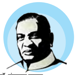
डॉ. शंकरराव चव्हाण जन्मशताब्दी वर्ष

शंकरराव चव्हाण हे स्वातंत्र्य चळवळ आणि हैदराबाद मुक्तिसंग्रामातून उभे राहिलेले नेतृत्व आहे. त्यामुळे त्यांच्या संपूर्ण वाटचालीत सर्वसामान्यांचे हित हेच केंद्रस्थानी राहिले.