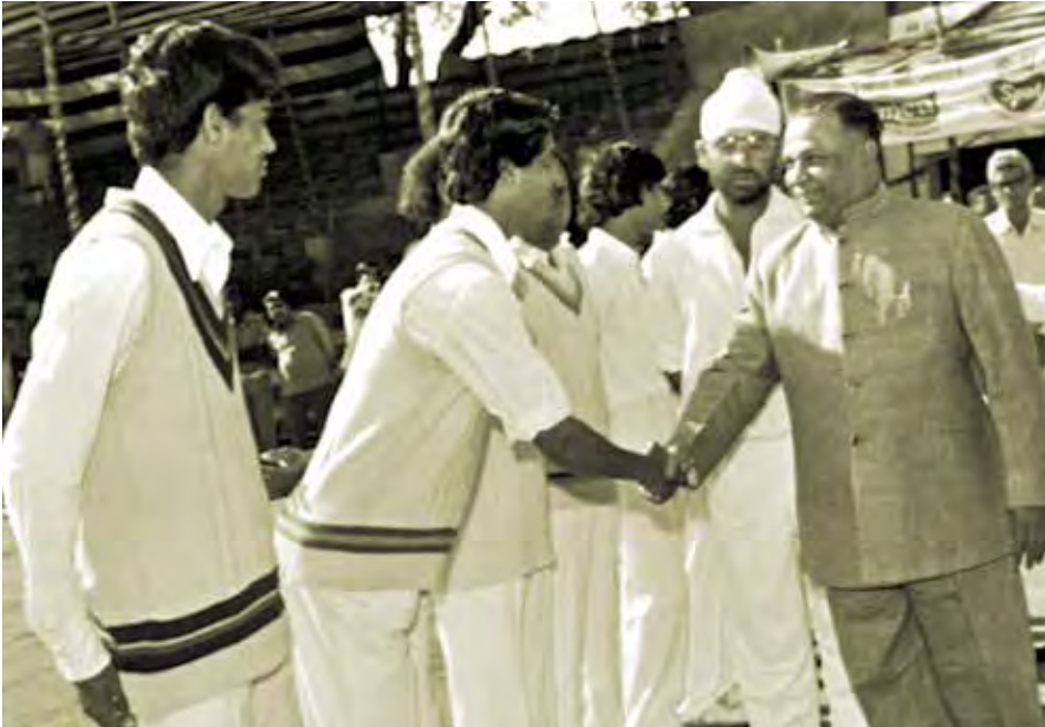
भारत-श्रीलंका कसोटी सामन्याचा शुभारंभ करताना शंकरराव चव्हाण