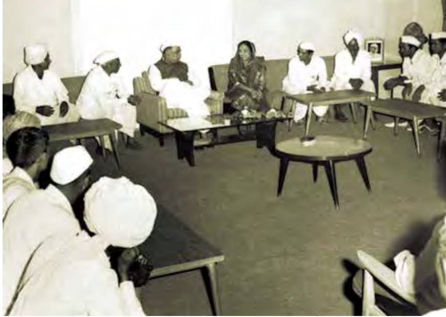
शेतकऱ्यांच्या समस्या जाणून घेताना मुख्यमंत्री शंकरराव चव्हाण.

हे सगळेच अवाक करणारे होते. मुख्यमंत्री या नात्याने शंकररावांनी जो शब्द तिथे दिला, त्यानुसार पुढे त्यांनी कार्यवाही करण्याबाबत आदेशही दिले. हे पुढे घडत गेले. दुसऱ्या दिवशी या घटनेच्या ठळक बातम्या सर्व वर्तमानपत्रांत छापून आल्या. भटक्या-विमुक्तांविषयी कणव बाळगणारे मुख्यमंत्री शंकररावजी चव्हाण त्या दिवशी मला जवळून अनुभवता आले. शंकररावांची अशी संवेदनशीलता त्यांनी मुख्यमंत्रिपदावरून घेतलेल्या निर्णयामधून आजही जाणवते. बळजोरीने