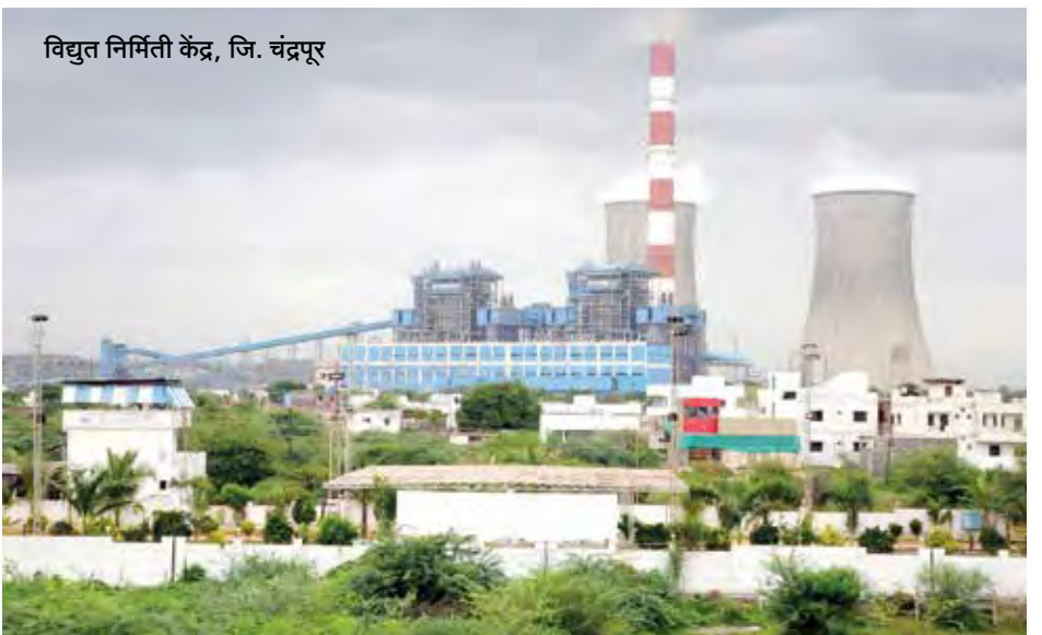
विद्युत निर्मिती केंद्र, जि. चंद्रपूर