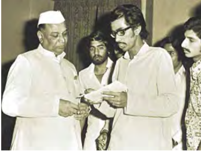
सर्वसामान्यांचे प्रश्न आत्मीयतेने ऐकून घेऊन त्यावर उचित कार्यवाही करणारे नेतृत्व.

१९४७ साली शंकररावजींनी आपला मुक्काम उमरखेड कॅम्पला हलवला. त्या काळी उमरखेड कॅम्प हे निजामविरोधी चळवळीचे केंद्र बनले होते. उमरखेड कॅम्पवरील शंकरराव चव्हाण यांच्या आयुष्यातील दिवस अक्षरशः मंतरलेले दिवस होते.