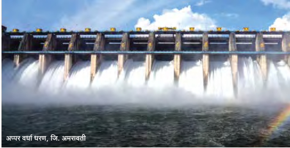
अप्पर वर्धा धरण, जि. अमरावती

माजी मुख्यमंत्री शंकरराव चव्हाण यांनी सिंचनासाठी अनेक महत्त्वपूर्ण प्रकल्प उभारून राज्यात मोठी सिंचनक्षमता निर्माण केली. राज्याच्या मंत्रिमंडळात संधी मिळाल्यानंतर त्यांनी पाटबंधारे विभागाची प्रामुख्याने निवड केली. १९७५ मध्ये मुख्यमंत्री झाल्यानंतर त्यांनी पाटबंधारे खाते आपल्याकडेच ठेवले. १९६० ते १९८० या कालावधीत ते सुमारे १४ वर्ष पाटबंधारे विभागाचे मंत्री होते. त्यांनी आपल्या कार्यकाळात भीमा, गोदावरी, चंद्रभागा या नद्यांवर मोठमोठ्या धरणांची निर्मिती केली. कोयना, जायकवाडी, विष्णुपुरी, कळम्मावडी, भीमा प्रकल्प, अप्पर वर्धा प्रकल्प, येलदरी धरण, अरुणावती, लेंडी धरण, बाभळी, सिद्धेश्वर आदी धरणे बांधून त्यांनी राज्यात हरितक्रांती घडवून आणली. त्याचबरोबर पारस, कोराडी, चंद्रपूर, परळी आदी ठिकाणी वीज निर्मिती केंद्रे सुरू करण्यावर त्यांचा भर राहिला. पाणी व वीज मुबलक उपलब्ध झाल्याने त्याचा लाखो शेतकऱ्यांना फायदा झाला. हे प्रकल्प म्हणजे श्री. चव्हाण यांची स्मृतिस्मारकेच. यांच्या कार्यकाळात उभे राहिलेले काही प्रातिनिधिक प्रकल्प.