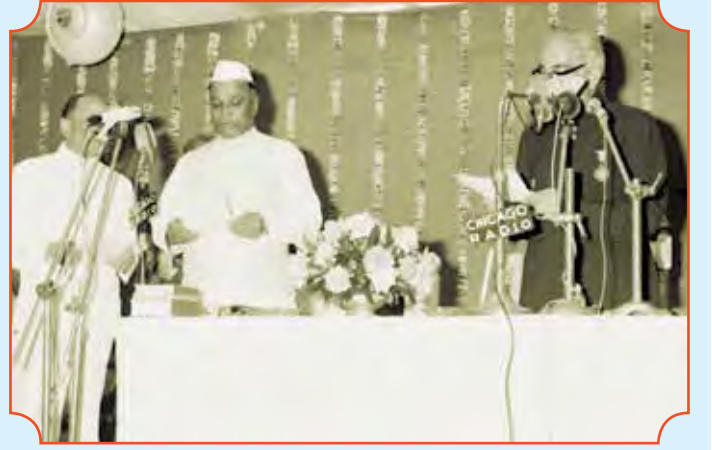
महाराष्ट्राच्या मुख्यमंत्रिपदाची शपथ घेताना शंकरराव चव्हाण.