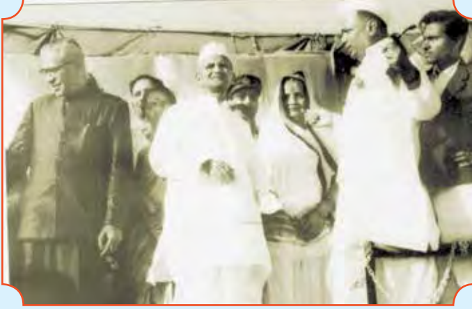
पैठण येथील जायकवाडी प्रकल्पाच्या भुमीपूजन प्रसंगी माजी प्रधानमंत्री लाल बहादूर शास्त्री आणि शंकररावजी चव्हाण.