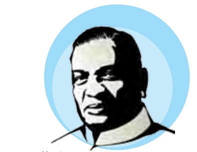
डॉ. शंकरराव चव्हाण जन्मशताब्दी वर्ष

महाराष्ट्रातून वेगवेगळे सांस्कृतिक कार्यक्रम सादर करण्यासाठी दिल्लीत आलेल्या कलावंतांना यशवंतराव आणि शंकरराव चव्हाण ही हक्काची जागा वाटत असे. विशेषतः युवा कलावंतांना