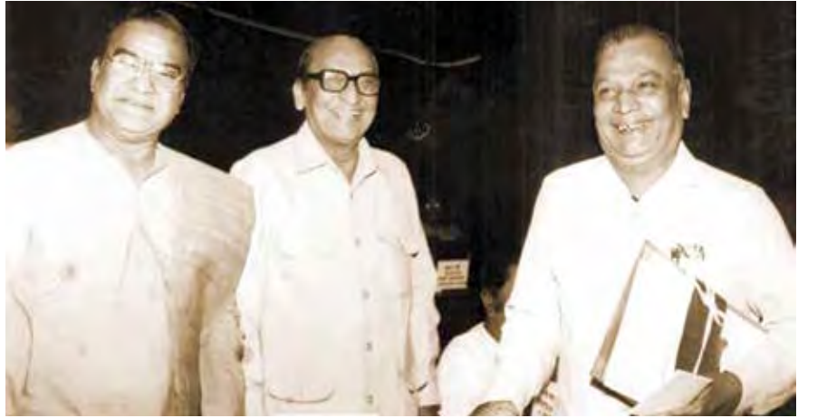
नवी दिल्ली येथे विज्ञान भवनात ७ एप्रिल १९८६ रोजी राष्ट्रीय एकात्मता मंडळाच्या बैठकीत महाराष्ट्राचे मुख्यमंत्री शंकरराव चव्हाण, आंध्रप्रदेशचे मुख्यमंत्री एन.टी. रामाराव आणि केंद्रीय विधिमंत्री अशोक सेन.

त्यांच्या त्या छोट्याशा कारकिर्दीमध्ये मी राज्यमंत्री म्हणूनच होतो त्या वेळाचा एक प्रसंग मला आठवतो, एक समाज कल्याण खात्याची नस्ती माझ्याकडे