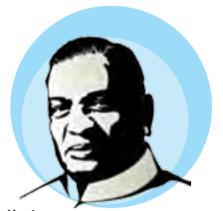
डॉ. शंकरराव चव्हाण जन्मशताब्दी वर्ष

माझे नाना शिस्तप्रिय, वक्तशीर होते, नियमावर बोट ठेवून चालणारे होते. त्यांच्या आचार- विचारात परखडता होती, स्पष्टता होती. आयुष्यात त्यांनी अनेक चढ-उतार पाहिले, जय-पराजय पाहिले. पण त्यांना कधी ना यशाचा दर्प शिवला, ना कधी अपयशाच्या निराशेने ग्रासले. वस्तुस्थिती स्वीकारून पुढे वाटचाल करण्याचा त्यांचा स्थायिभाव होता.