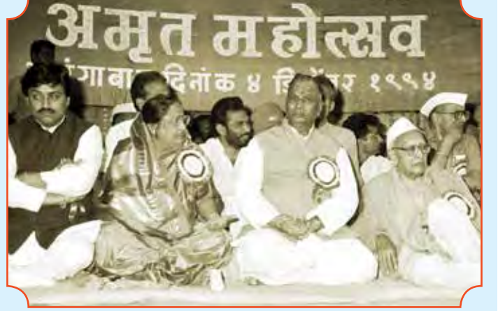
ज्येष्ठ स्वातंत्र्यसेनानी गोविंदभाई श्रॉफ यांच्यासमवेत शंकरराव चव्हाण.