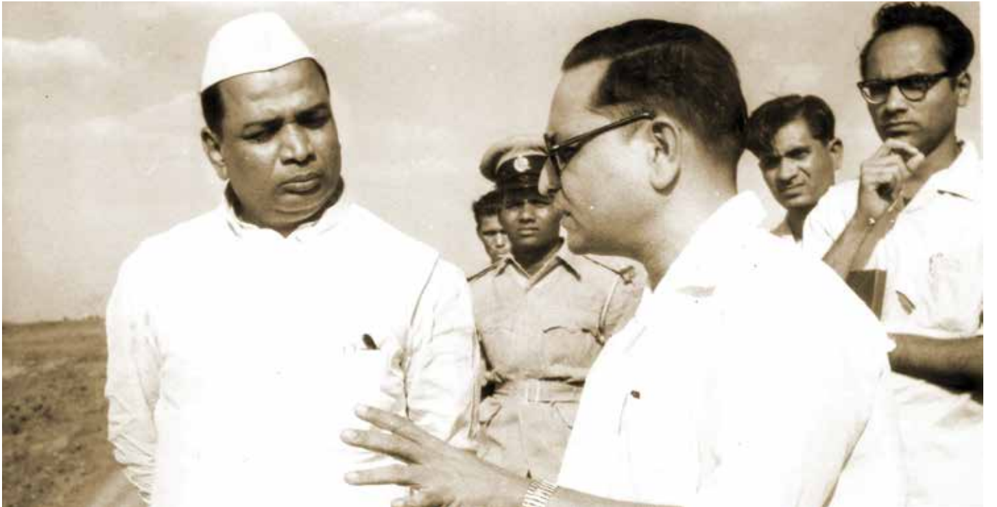
प्रकल्पांची पाहणी आणि अधिकारी यांच्याकडून माहिती घेताना.