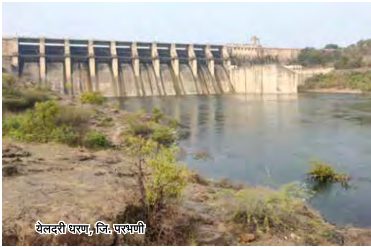
येलदरी धरण, जि. परभणी