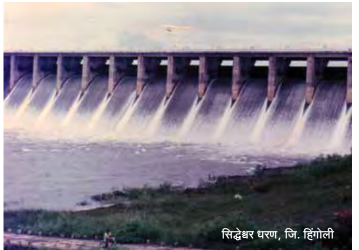
सिद्धेश्वर धरण, जि. हिंगोली