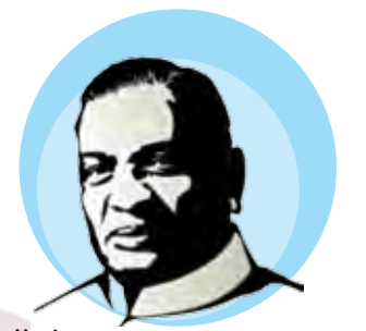
डॉ. शंकरराव चव्हाण