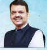
देवेंद्र फडणवीस मुख्यमंत्री